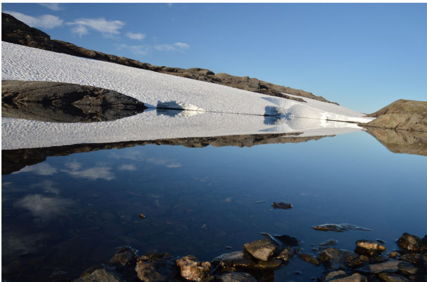
Tyssevassbu, jezero vedle našeho stanu

Po asi hodině chůze jsme si na dalším rozcestí pod horou nechali batohy a šli si nalahko vyjít na vrchol. No jo, stolová hora měla ze všech stran pěkné, avšak skoro kolmé stěny. Jak naznačila mapa,