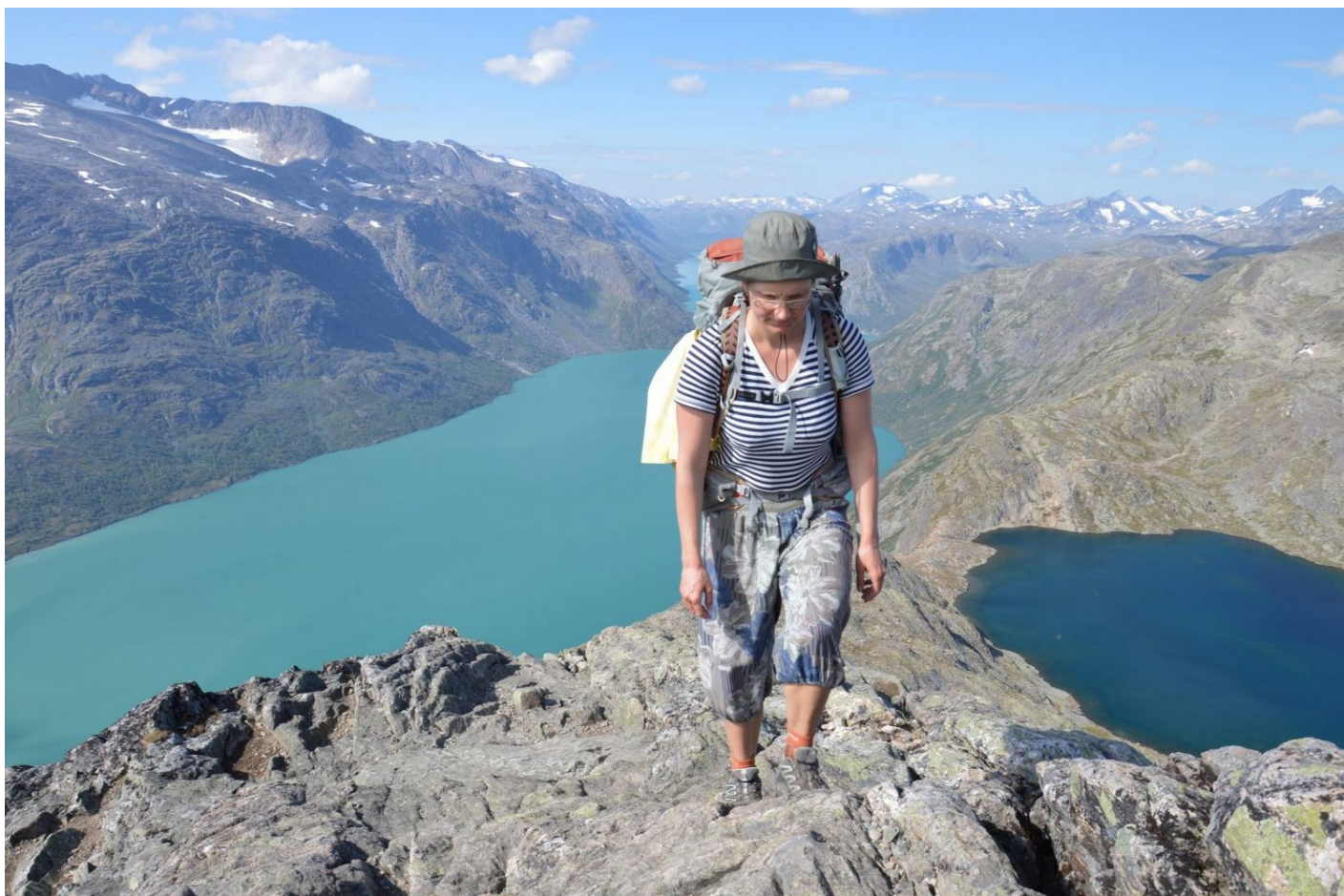
Bessegen, ikonické místo norské turistiky