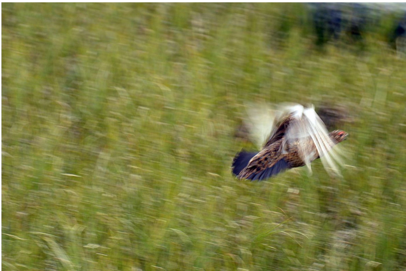
Že by slepice?