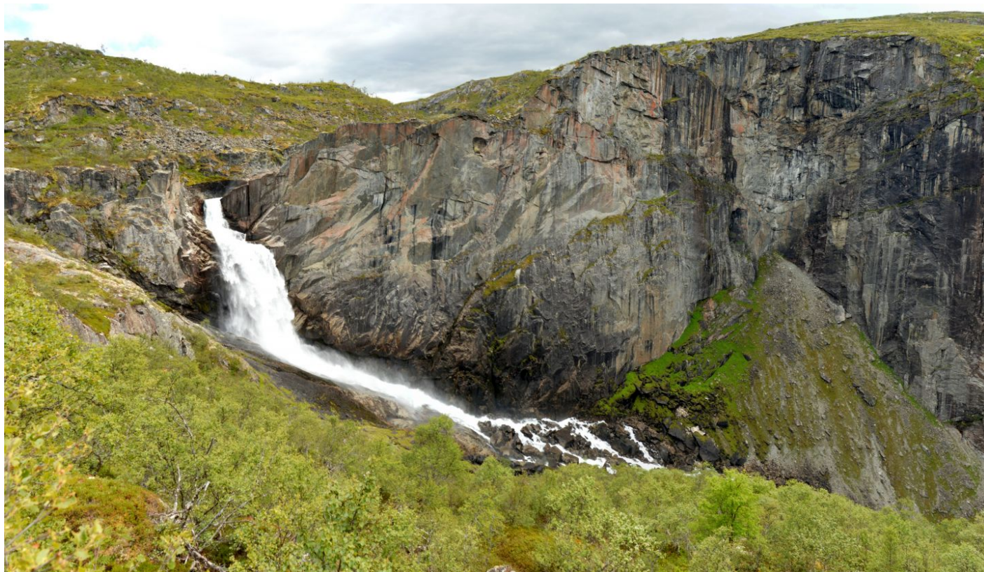
Trochu utajený vodopád Valurfossen

výhledem na vodopád Valursfossen, odhadl jsem 150-200 metrů volného pádu vody. Prý se dá někde tady i sejít dolů k řece, až pod vodopád.