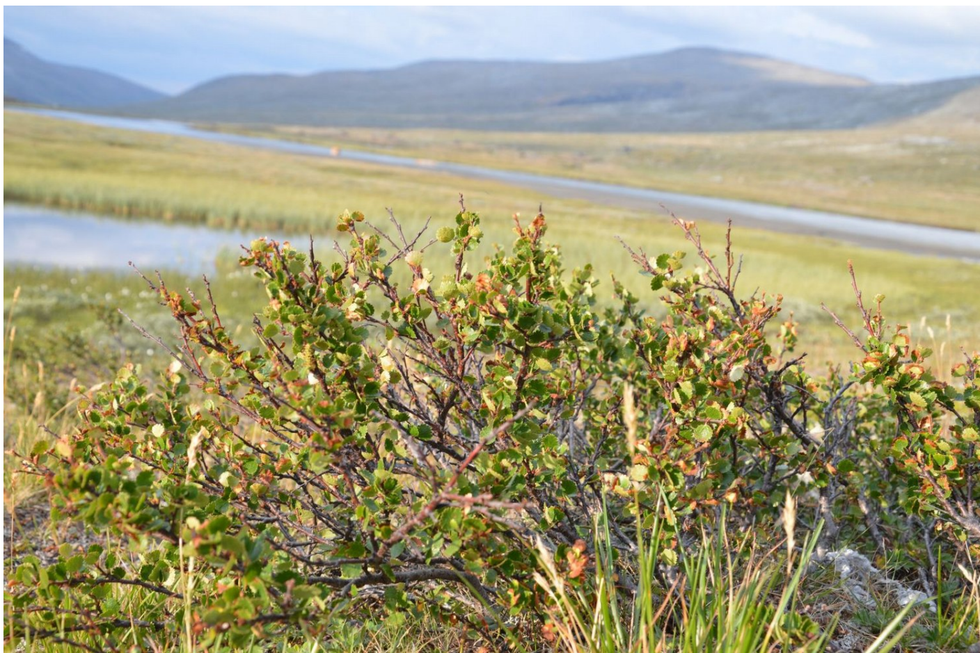
Krásné údolí Veodalen pod Glittertindem

Od čtyř v noci do dvanácti: Déšť, spánek, snídaně, déšť, spánek, déšť. Po poledni přestalo pršet, chvíli jsme počkali, zda se déšť nevrátí, a mohli jsme vyrazit na cestu. Dnešní etapa měla být spo-