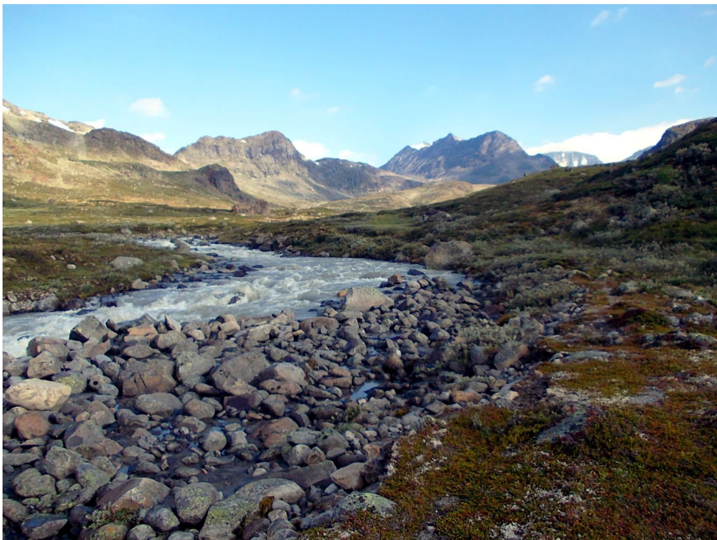
Nádherné údolí Memurudalen nad jezerem Gjedne

my se mohli kochat ledovcem přímo pod námi, byl na druhé strany hory, než jsme přišli. O kus dál se na ledovec dalo i šáhnout, zasahoval až na vrchol; jinde byl na vrcholu odtátý. V dálce jsme zahlédli horu Glittertidden, jen nejvyšší Galdhøpiggen byl stále zahalen mraky. Při sestupu z vrcholu jsme potkali ten den prvního turistu, vydal se na vrchol druhou možnou výstupovou cestou, zkratkou přes hřeben Raudhamran a řekl nám, že to je v pohodě. Tak jsme tedy zkusili na sestup tuto cestou, i když ranní cesta podél řeky byla moc pěkná. Nejprve se šlo po příjemných kamenných plotnách a plochých kamenech, tyto úseky bohužel brzy skončily. Následovala „nekonečná“ kamenná pole, furt po hřebeni, nahorů-dolů, vysoko ve svahu. Za deště bych někde uklouzl a upadl a za mlhy snadno zabloudil, jelikož značení nebylo moc dobré. Slunce pražilo, mraky se definitivně rozplynuly. Cesta mi přišla nekonečná, i jsme měli pár lezeckých úseků pro zapojení rukou. Teprve po třech hodinách schůze po hřebínku jsme začali pořádně klesat: prudký sešup nejprve po trávě a pak lesíkem zpět do k řece Muru.