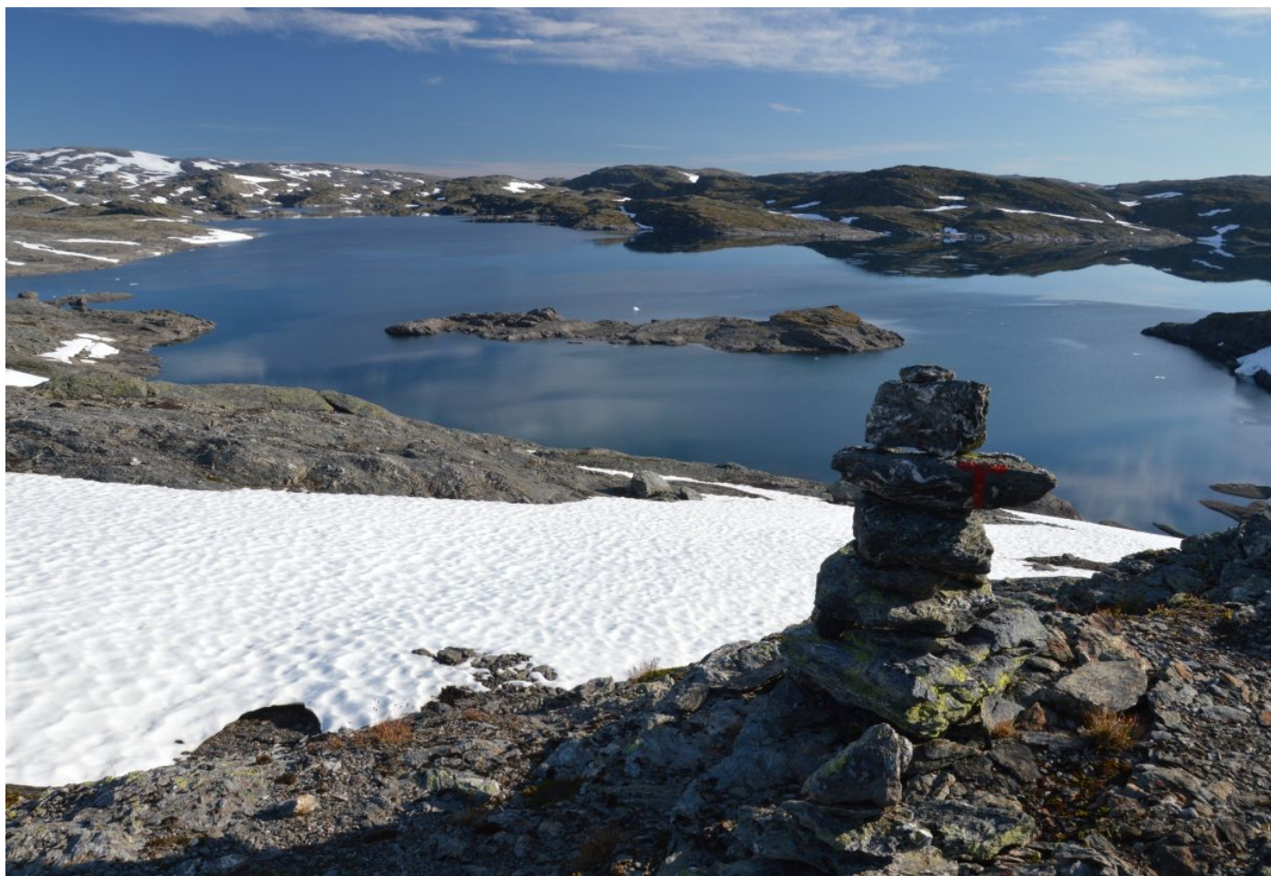
Čarokrásná krajina na Hardangerviddě

Co pálí do rozpálených noh na úzké pěšince více: jalovcová, vrbová či březová kosodřevina? Jalovec byl v horách nízký a bylo ho málo, vrba byla celkem příjemná, nejhorší byly právě husté porosty bříz: pěkně štípaly do holení a do lýtek rozpálených od slunce.