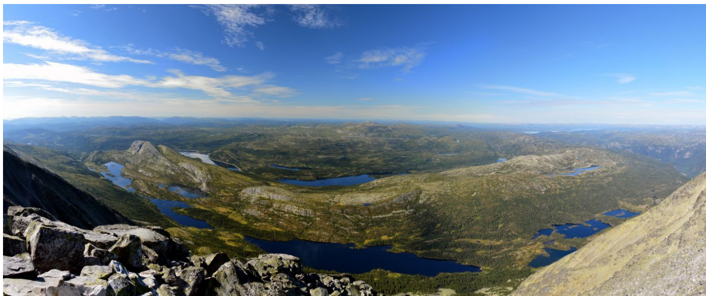
Na vrcholu Gaustatoppen, dole údolí Gausdalen

tábořiště jsme překročili první potůček se svěží vodou, cestou byly i další: to jsme včera nevěděli. Asi po půl hodině chůze skoro po rovině započal vlastní výstup. Cesta nás vedla nějakou dobu lešákem a pak pak už jen nad hranicí lesa, s výhledy, po občas kamenité cestičce vzhůru do stěny masivu Gausta. Někdo bylo hodně kamenů, jinde malá suťoviska. Ochutnali jsme první borůvky a stále dobrá pěšinka nás vyvedla na hlavní hřeben a taky z chladivého stínu na horké slunce. Stále byly super výhledy, hlavně na jezera v částečně zalesněném údolí Gausdalen. Cesta se stočila k severu a vedla už jen čistě po kamenech. Kus pod „vrcholem“ se spojila s tzv. normálkou, vedoucí od parkoviště (z 1180 metrů), od východu: kameny byly přeskládány, aby se dalo pohodlně kráčet a byly také pěkně ošlapány. Po deváté, za tři a čtvrt hodiny jsme byli u vysílače, na „vrcholu“. Čekali jsme na davy, ale nikde nikdo, jen první ranní běžec. Vysílač, chata a horní stanice podzemní dráhy nejsou všechny na pravém vrcholu, ale jen na předvrcholu. Pokračovali jsme na samotný vrchol, který byl hned vedle, vzdálený pouhých 500-700 metrů. Cesta byla perfektně značena, ale nezajištěna. Malé kameny se změnilly na větší a pak na balvany. Značka vedla celou dobu po uzounkém hřebínku. Z dálky vypadala, že vede stále po rovině, ve skutečnosti jsme při přelezání a obcházení balvanů lezli stále nahoru a dolů.