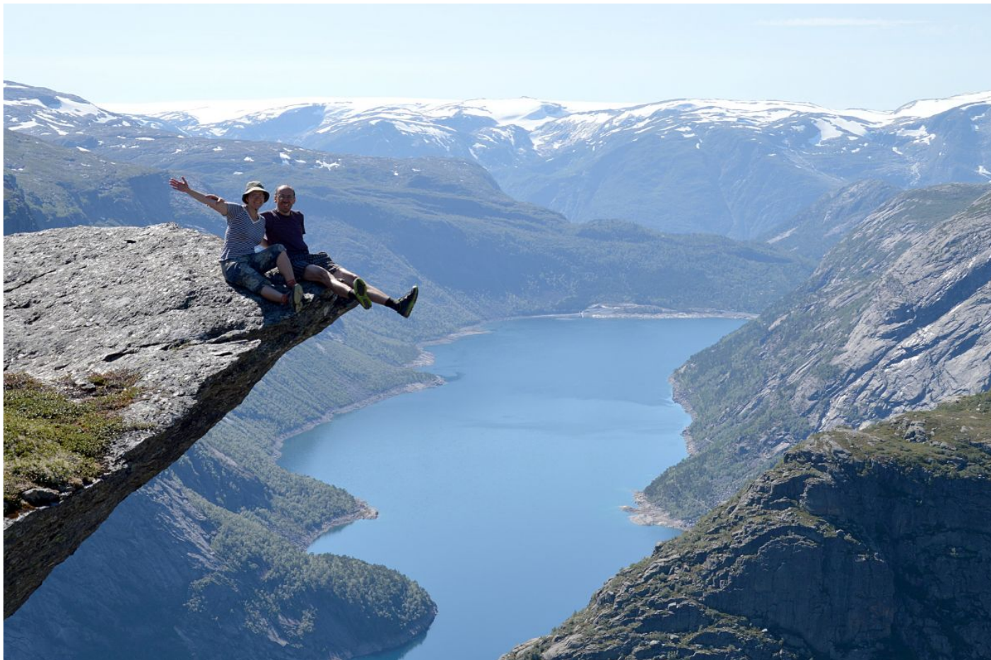
Naše soukromá Trolltunga

Propagační fotografie nelhaly, bylo to krásné místo, zužující se vodorovně položená skála trčící nad volný prostor. A dole ona sluncem nasvícená přehrada. Už od rána jsme potkávali spousty turistů v obou směrech. Tady už byl spíše dav, dlouhá fronta lidí, čekající před Trolltungou. Každý se na ní chtěl vyfotit. Ptám se pána, který ještě nějakou dobu bude čekat ve frontě, jak dlouho čeká: „Tři hodiny!“. Díky, to jsme nechtěli. Stačilo nám si nafotit cizí lidi a prozkoumat blízké okolí, všude byly nějaké pěkné skály. Když už jsme chtěli odejít, objevil jsem náhodou vedle „velké“ Trolltunga tzv. „malou“ Trolltunga, také převislou skalku. A u ní jen pět lidí. Nechali jsme si udělat pár společných fotek a nemuseli čekat frontu. Výhled byl stejný, okolní hory a skály, přehrada dole a v dálce ledovec. „Velká“ Trolltunga je krásná ne výhledy, které jsou všude okolo stejný, ale krásná je pohledem na lidi, kteří jsou na ní: aneb právě jen tou fotkou „z odstupu“.