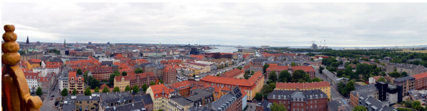
Kodaň z Kostela Spasitele