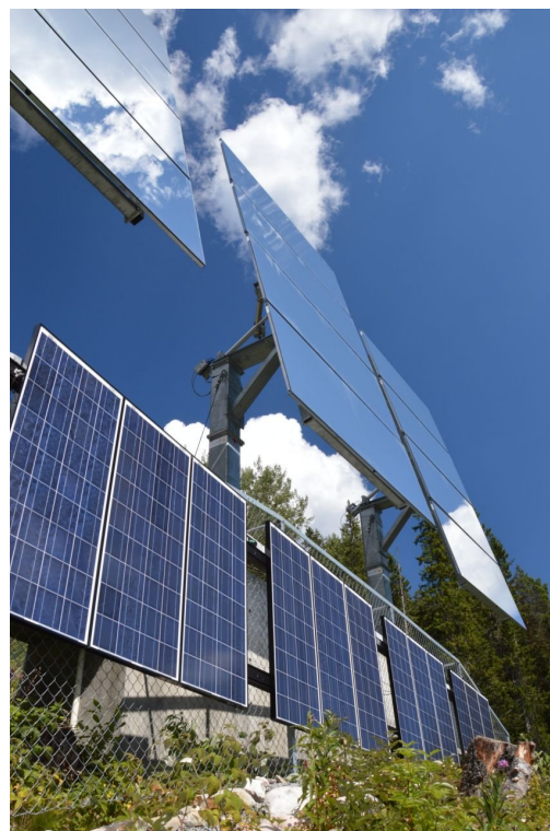
Zrcadla nad Rjukanem

Dnes jsme chtěli zdolat vrchol Gausty a následně sestoupit až dolů do Rjukanu. Vzhledem k velké vzdálenosti, náročnosti a převýšení jsme výstup začali brzy ráno. Již před šestou ranní jsme nalahko šli pěkným údolím Gausdalen (celkem zde je asi 10-15 jezer), hluboko ve stínu. Kousek od