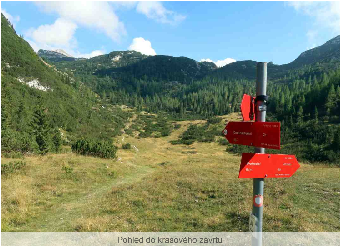
Pohled do krasového závrtu

K snídani měla Janča míchaná vajíčka a já domácí chleba s marmoškou, Bára dostala od každého trochu. Ve tři čtvrtě na osm jsme vyrazili přímo po hřebenu hor, nad hranicí lesa. Po deseti minutách přišel první náročný úsek. „Ne! Já se bojím! Těžký batoh s dítětem, druhý batoh vpředu, takže si nevidím pod nohy, nevejdu se k žebříku a nemohu se držet zblízka lana (batůžek vpředu překáží), Janča má břicho...“ Hlavní bylo se vrátit ve zdraví domů, ne nutně projít každou cestou.