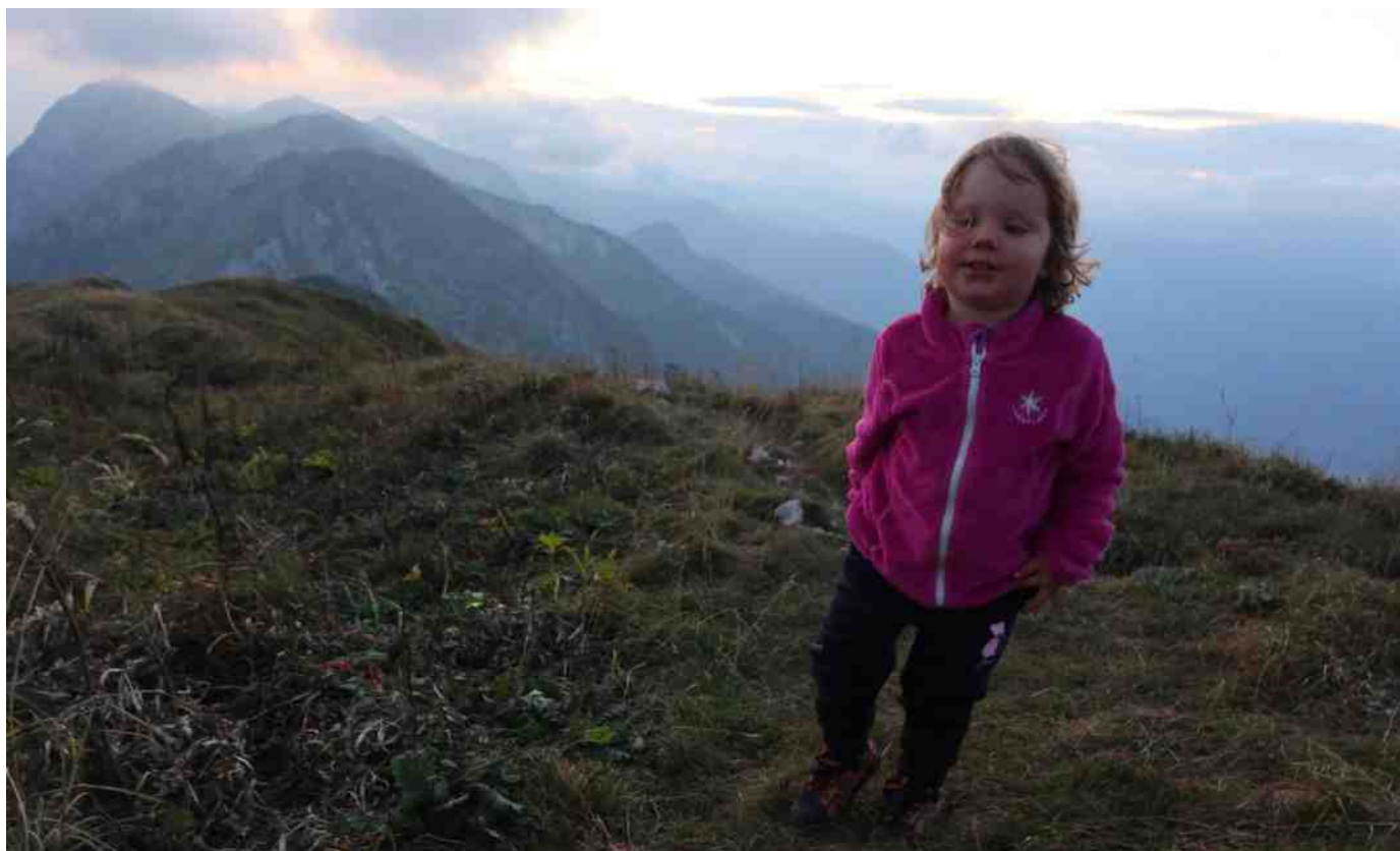
Na vrchu Črna prst