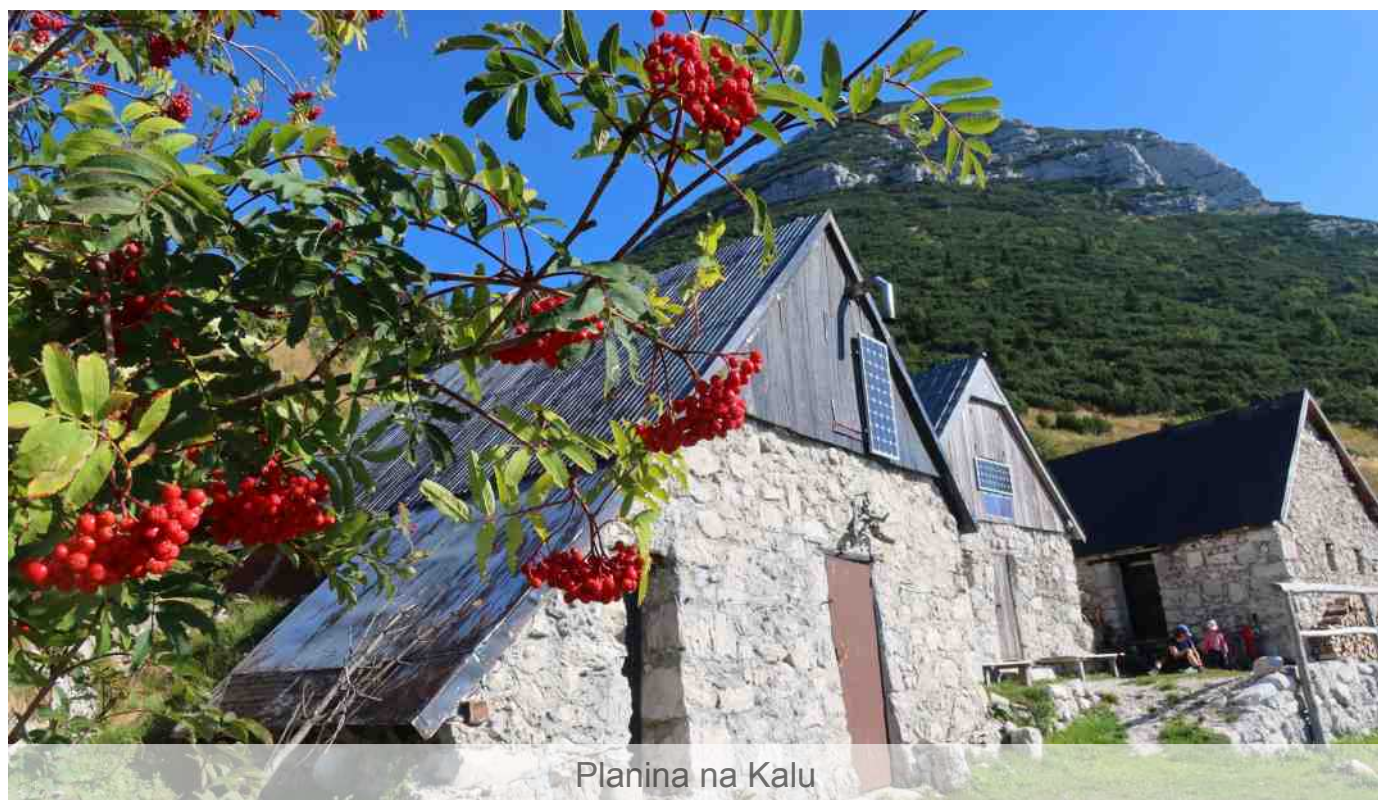
Planina na Kalu

– „Chtěli bychom se ubytovat?“ – „Nejde!“ – „Co?“ – „Máme plno!“