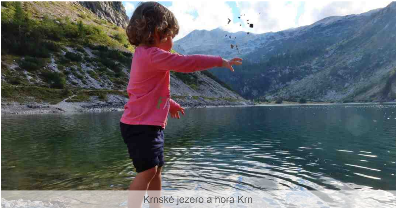
Krnské jezero a hora Krn

V chatě už byly ubytované dvě školní skupiny a další turisté. Nejbližší další chata byla hluboko v údolí, tam s dítětem nepůjdeme. Na chatě jsme spali před lety a také tu byl školní zájezd (a k tomu silně přšelo a na kopcích sněžilo). Asi to tu školy mají moc rády. Po chvíli nám kuchařka nabídla, že budeme spát ve služební pokoji. Dostali jsme dobrou radu, udělat si pro příště rezervaci dopředu. Oddech, kafe a vynikající štrúdl, plný jablek. Chata stála na atraktivním místě, ale přímo od ní nebylo přes hustý les skoro nic vidět.