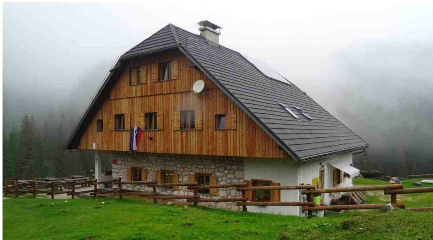
Koča na Planini pri Jezeru (za mlhy a deště)