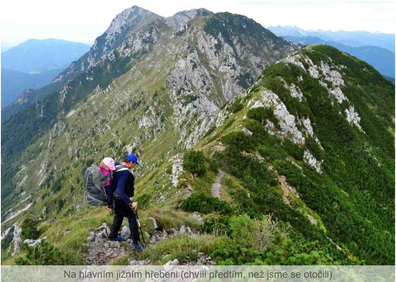
Na hlavním jižním hřebeni (chvíli předtím, než jsme se otočili)

V noci byl „božský klid“ a tma! S vědomím dlouhé cesty jsme si objednali jídlo již na půl sedmou. V tu dobu vycházelo slunce, bohužel do mraku a do oparu. Oproti večeri jsme dostali snídani jen s mírným zpožděním: míchaná vajíčka pro Janču a domácí chleba s marmoškou pro mě, Bára jedla od každého trochu. Ve tři čtvrtě na osm jsme vyrazili k západu přímo po hřebenu hor, nad hranicí lesa. Po deseti minutách přišel první traverz a výhled na náročný výstup a sestup.