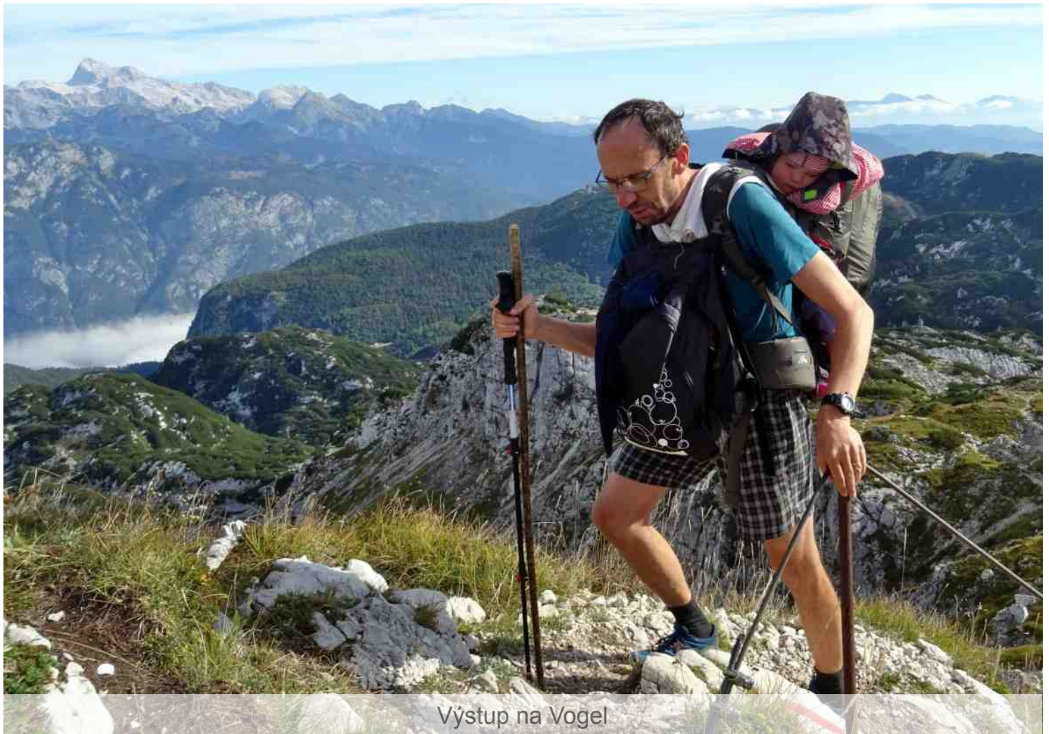
Výstup na Vogel