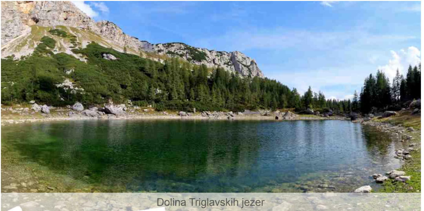
Dolina Triglavskih jezer