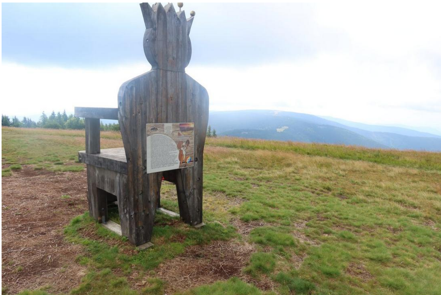
Na Veliké Kopě, druhé nejvyšší hoře Pohorje