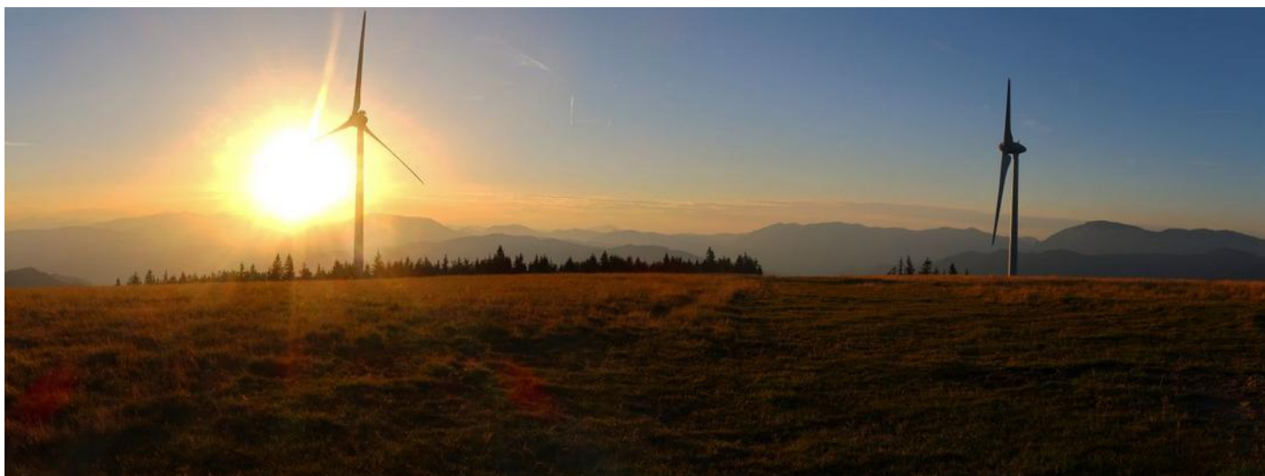
Západ slunce na hoře Amundsenhohe

od rána jsme šli po dálkové cestě Via Alpina , která vede až na východní cíp Rakouska. Chata stála nad krajem řídkého lesa, kolem se pásly krávy a všude kolem byly větrné elektrárny. Recepční o nás věděl a bez problémů a prokazování se dokumenty jsme se v noclehárně ( Matratzenlager ) pod střechou, s krásnými postelemi, ubytovali. Po dvaceti eurech a děti zdarma. Platební karty tady brali: což bylo skvělé, protože zatím skoro všude na rakouských horách chtěli jen hotovost.