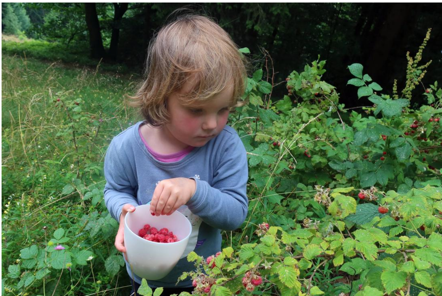
U koči pod Kremžarjevim vrhom