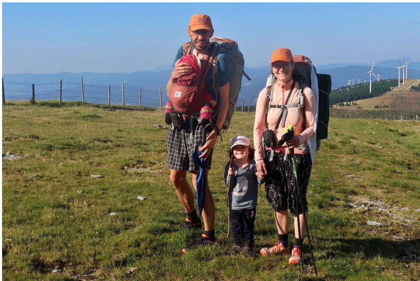
Ráno na kopci Pretul