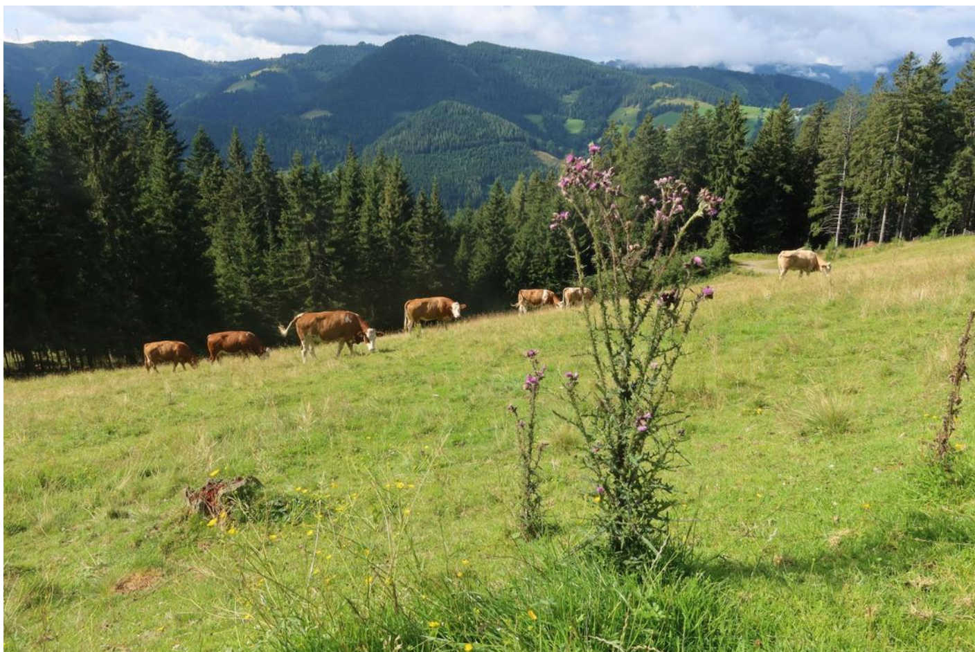
Rakouská klasická krajina, Fischbacherské Alpy