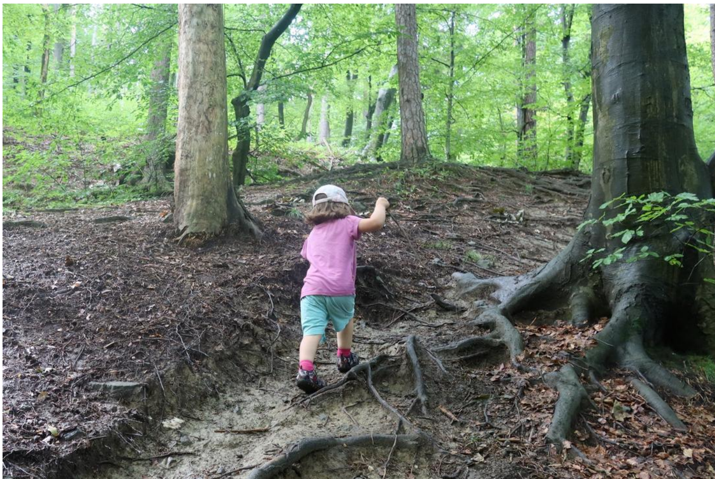
Výstup do Pohorje

– „Ve stanu je to boží. Je to v něm lepší než v chatě,“ pronesla Bára, když jsme jí oznámili, že dnes budeme spát ve stanu.