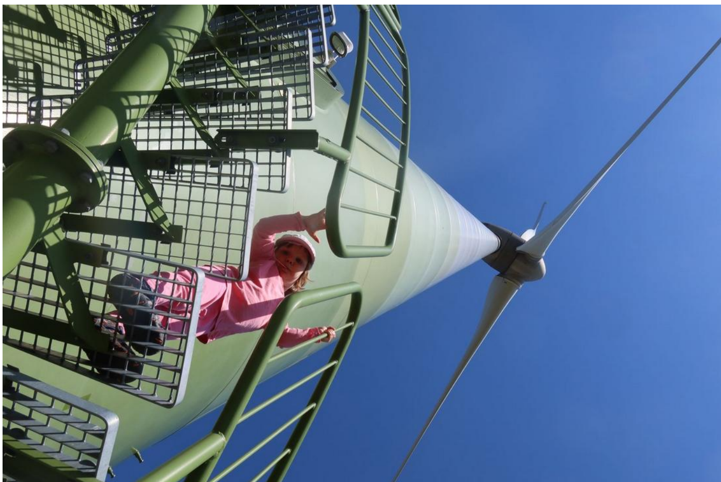
Na kopci Pretul

Dole na ukazateli bylo ráno napsáno, že to má být čtyři hodiny a nám to trvalo (i s pauzou na praní plen a sváču) jen o deset minut déle, takže tříleté robátko šlo samo tempem dle rozcestníků. Už