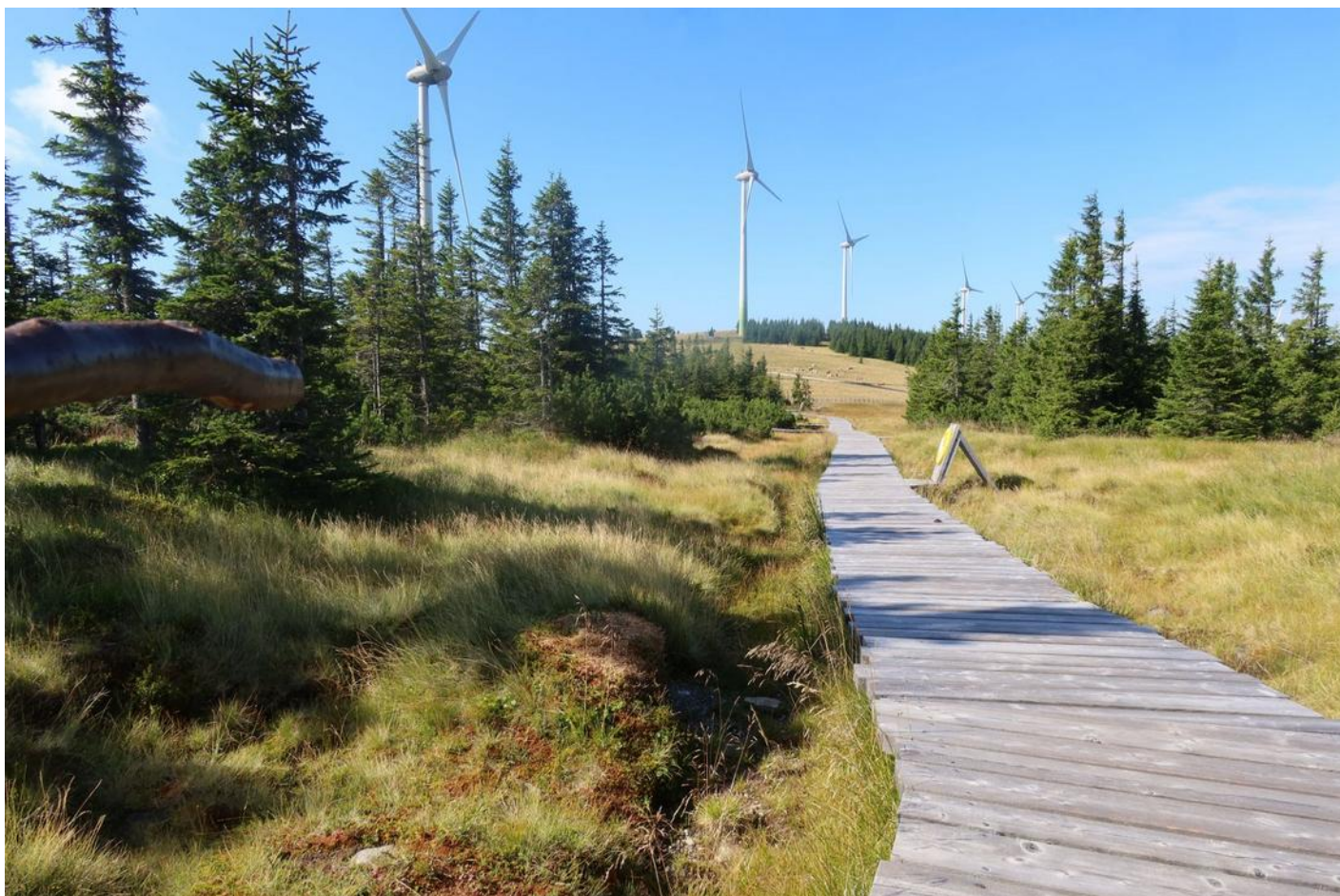
Vrcholové rašeliniště Schwarzriegelmoos

na Stuhleck, což jsme hravě zvládli. Od rána jsme potkali stěží osm pěšáků a asi čtyři cyklisty. Ukazatel na chatě sliboval dvě hodiny chůze, my tam byli za 2 hodiny 10 minut, i s delší zastávkou na rašeliništi. Do kopce jsme tak chodili tempem, jak uváděly ukazatele.