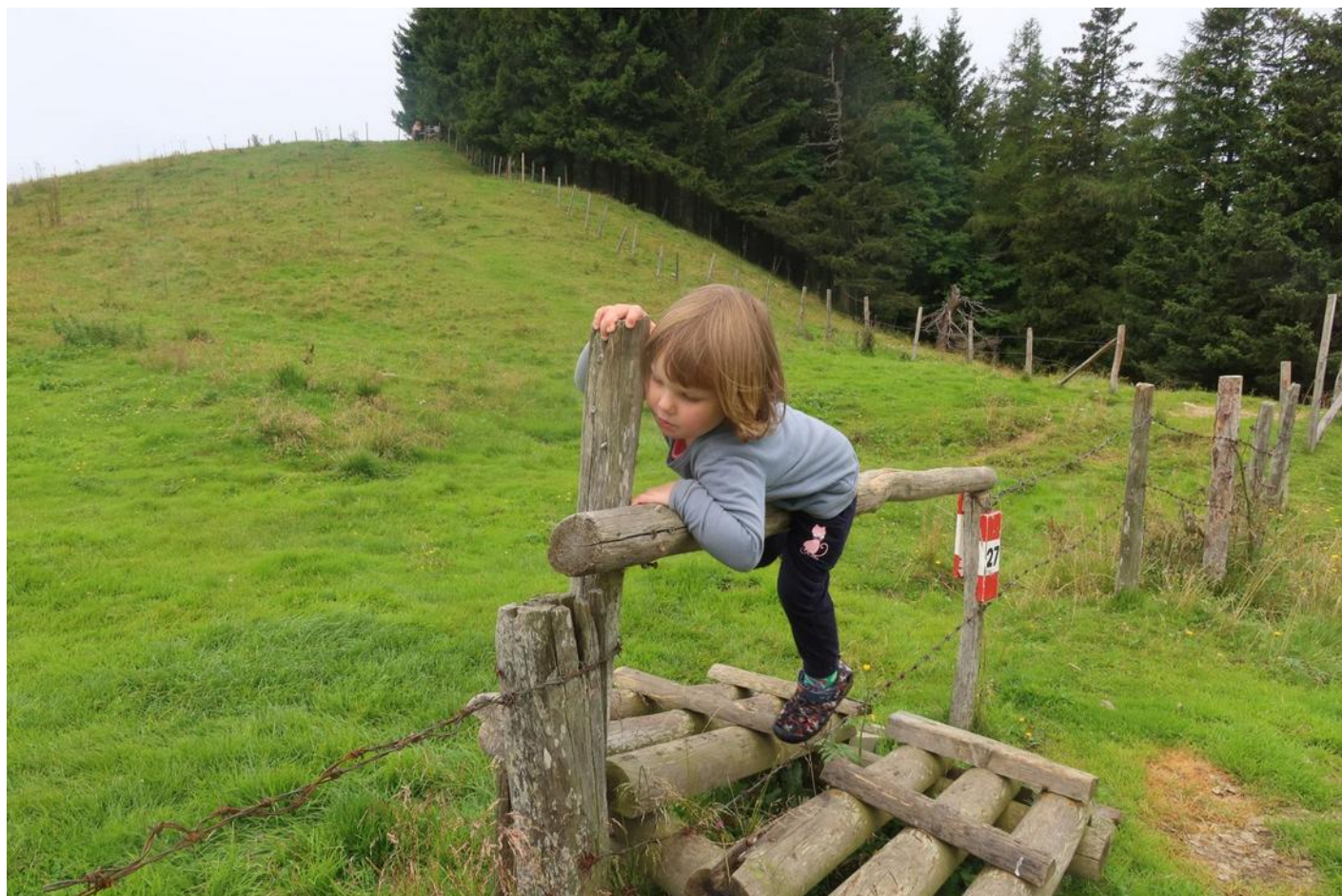
přes kraví ohrady

Malinkým problémem byly všudypřítomné ohradníky, které se nedaly všude překonat, takže jak se šlo i jen mírně odlišně od turistického značení, bylo nutné se případně kus vrátit. U vrcholové nádrže na zasněžování se poprvé rozpršelo, nasadil jsem si pláštěnku na batoh a vzal si deštník. Pokračovali jsme po pastvinách podél ohradníku, minuli jsme naši první větrnou elektrárnu.