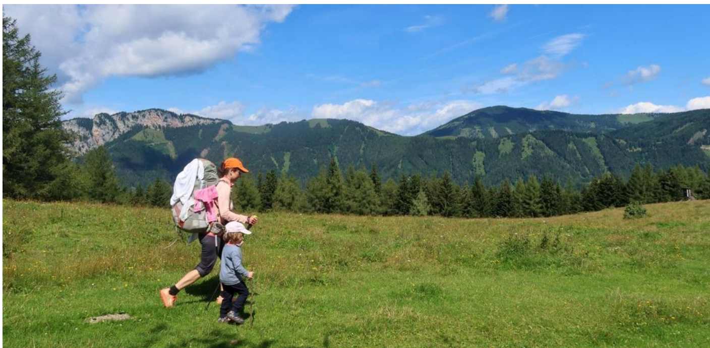
V pohoří Grazer Bergland, vzadu Medvědí soutěska

Plazy (sesuvy) se snad rychle odstraní, silnice opraví a vše se vrátí do normálu. Dnes ráno jsme koukali, že zavřenou hlavní silnici k Drávě začínají alespoň dočasně opravovat: doplňovali chybějící kamenný podklad, který sebrala voda.