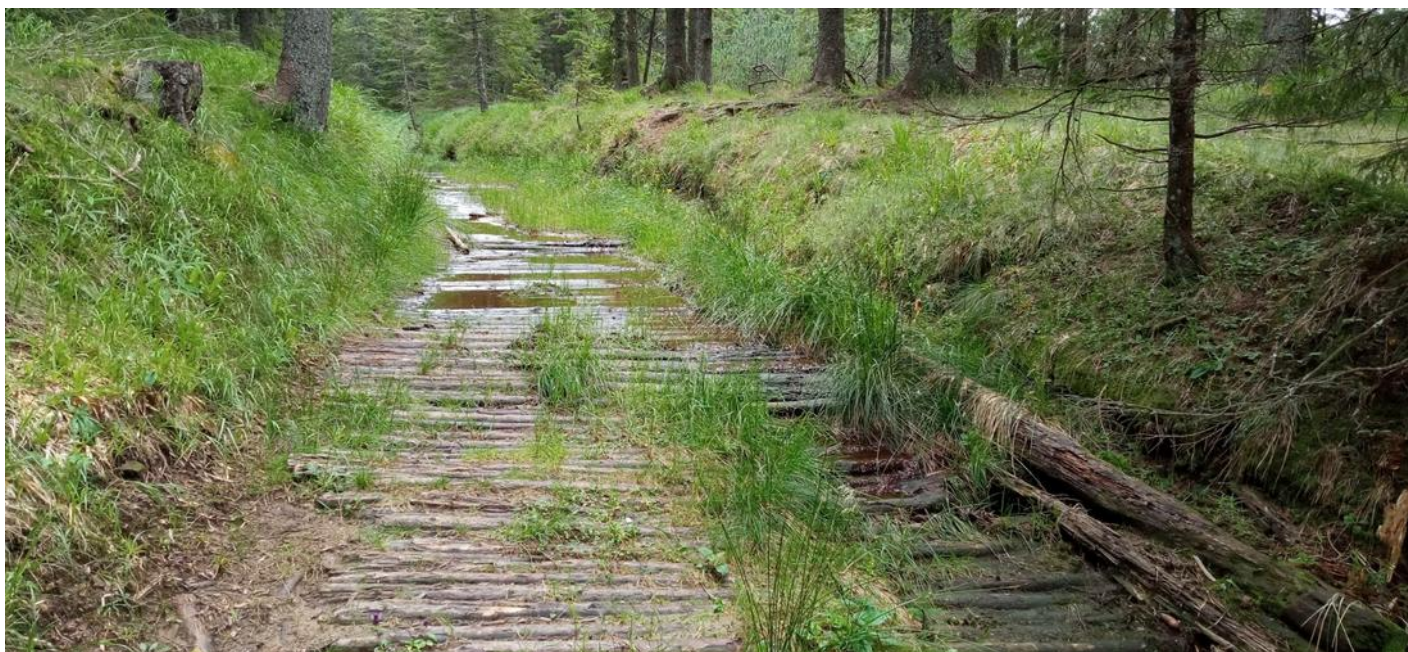
Ukázkové slovinské Laponsko