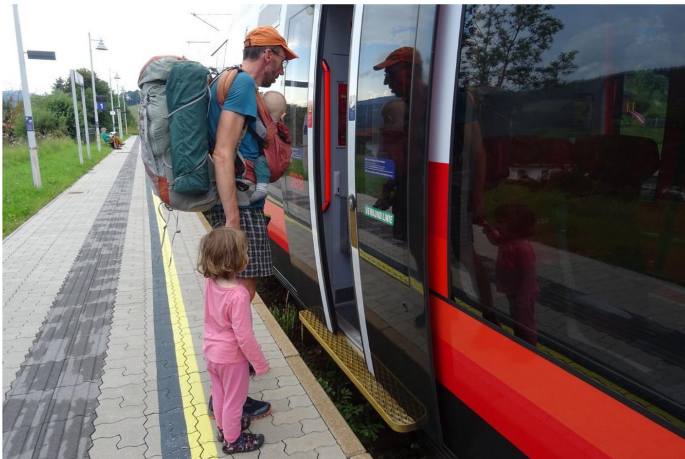
Putování po slovinských a rakouských horách skončilo

Ne 13. 8. Roseggerhaus–Stuhleck – Spital am Semmering /pěšky 13 km, 300 m stoupání, 1100 m klesání/; Spital am Semmering – Semmering–Brno /vlak/