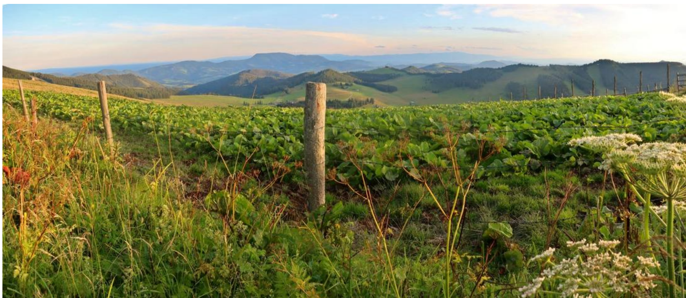
Fischbacherské Alpy, západ slunce od hor Heulantsch