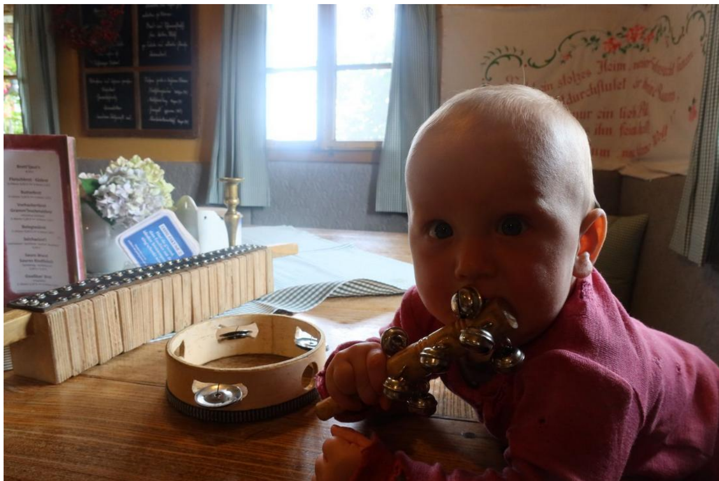
V chatě Strasseggwirt

9. 8. Heulantsch–Strasseggwirt /8 km; 250 m vzhůru, 550 m klesání/