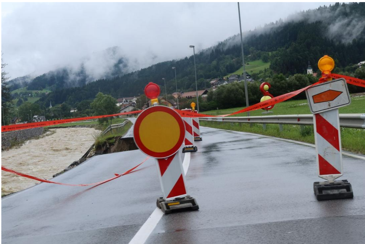
Slovenj Gradec: zatím chybí jen půlka hlavní silnice

jsme i silničky. Bára šla od rána v gumákách a brzy se jí na obou nohách udělaly puchýře. Po dvou hodinách jsme sešli na silnici, znovu se pořádně rozpršelo, zapláštěnkovali jsme se a za další půlhodinu jsme ve slejváku v půl dvanácté došli do Slovenj Gradce. Cestou byl potok, který měl koryto až po okraj plné vody.