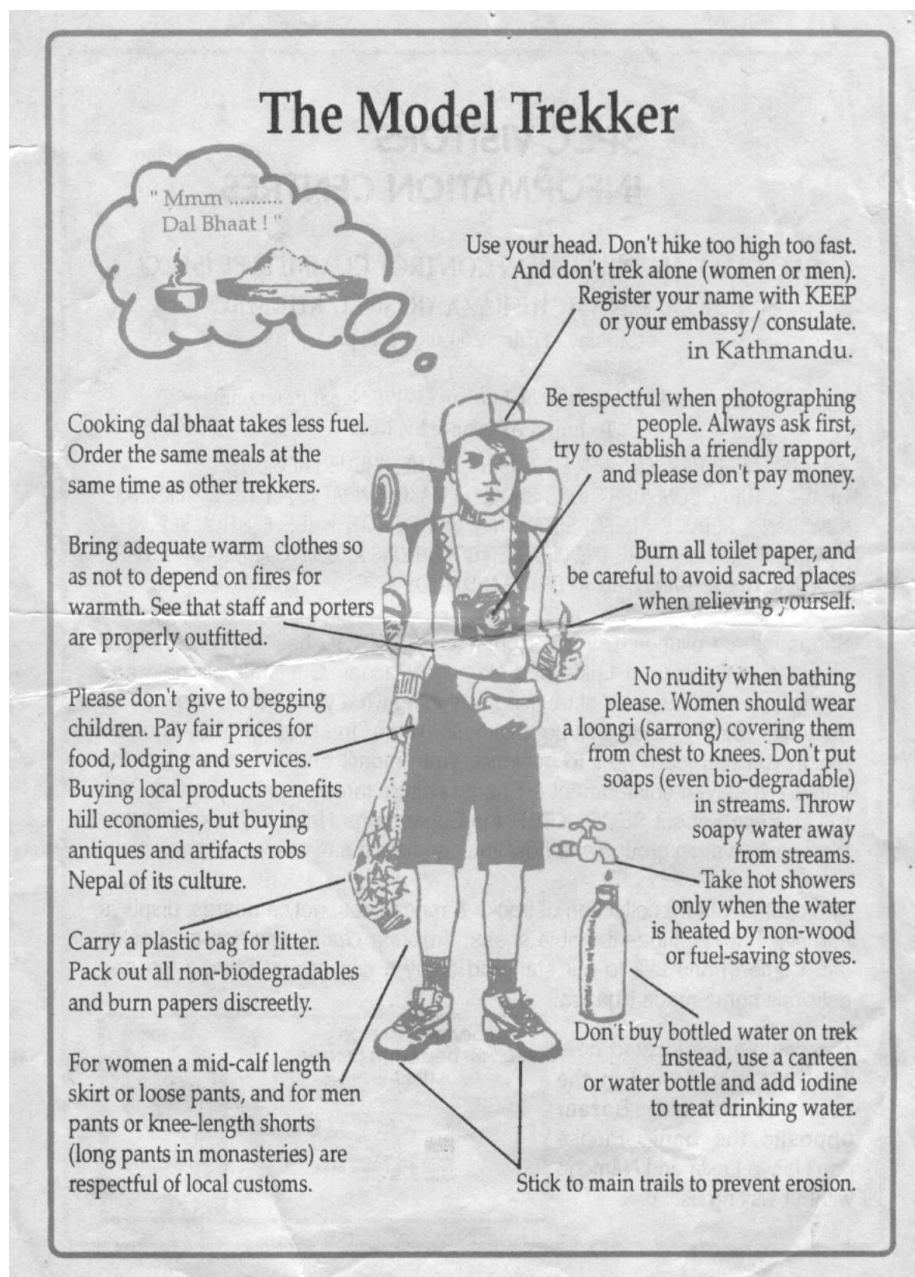
Obrázek 6.2: Model trekaře — materiál rozdáváný při vstupu do Národního parku Sagarmatha (Mount Everest).